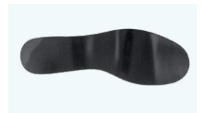
PLANTA ACERO ANTIPERFORACIÓN 1100 N