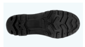
SUELA PVC + CAUCHO NITRILO

Tel: (+34) 965 310 613 Fax: (+34) 965 312 185