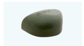
PUNTERA ACERO Anti-impactos 200 J