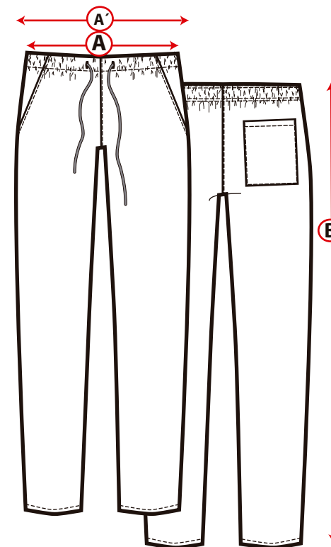
Tabla de medidas